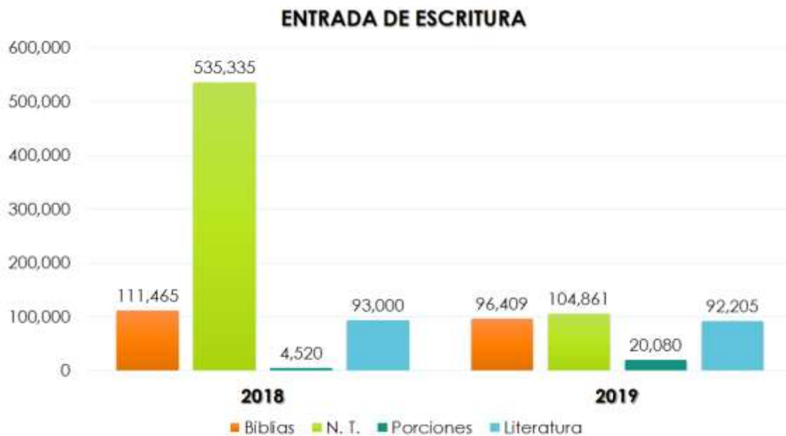
TABLA 2018 -2019