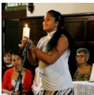
La mujer es fuente de luz

El Día Mundial de Oración busca potenciar la solidaridad, la unidad cristiana y la reflexión sobre temas de la realidad, entendiendo el poder de la oración como acción eficaz del pueblo de Dios. Así mismo sirve para sensibilizar a los pueblos con las problemáticas de otras personas, países y culturas, y orar con y para ellos.