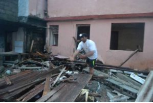
Imágenes de las afectaciones.