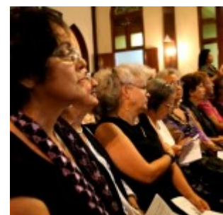
Una jornada llena de mujeres