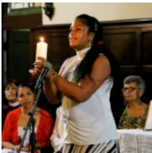
La mujer es fuente de luz

El Día Mundial de Oración busca potenciar la solidaridad, la unidad cristiana y la reflexión sobre temas de la realidad, entendiendo el poder de la oración como acción eficaz del pueblo de Dios. Así mismo sirve para sensibilizar a los pueblos con las problemáticas de otras personas, países y culturas, y orar con y para ellos.