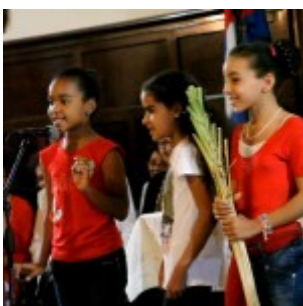
A las niñas y los niños estuvo dedicada la jornada